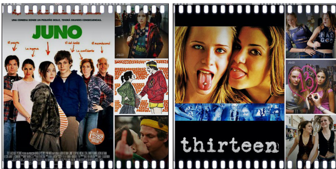
Figura 2. Thirteen (Catherine Hardwicke, 2003)